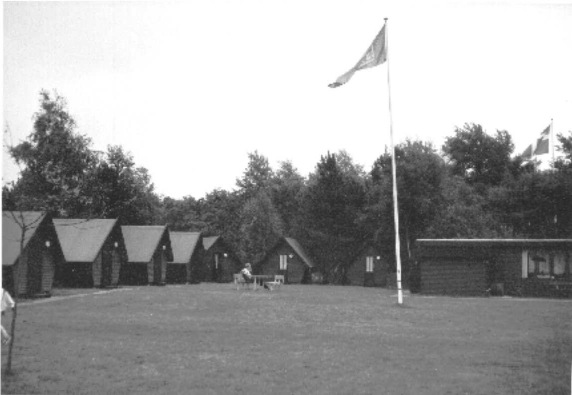
Campingplatz in Randers